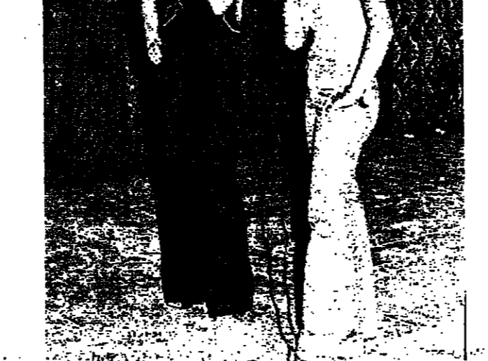
طالبات خلال مسرحية «مطالب بنات هالايام»

بنفسية اذتاحت السنة الدراسية ٧٦ - ٧٧ اقيمت الدورة الحادية في الغازية في المدرسة المركزية في قريته التي احتفل بها الابي رينا الخوند ووضعه جمهور كبير من اهالي المنطقة لبدء الخطة وبعد القياس توجه الجميع الى المدرسة حيث حضروا الخطة الدراسية التي اقامها اساتذة وطلاب المدرسة.